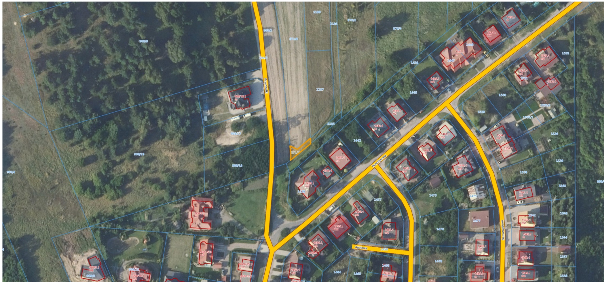
Mapa 1:500 (Ortofotomapa)