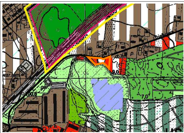
WYRYS ZE STUDIUM UWARUNKWAŃ I KIERUNKÓW ZAGOSPODAROWANIA PRZESTRZENNEGO MIASTA KONINA SKALA 1:10000