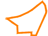
OZNACZENIE GRANIC OBSZARU OBJĘTEGO ZMIANĄ PLANU MIEJSCOWEGO